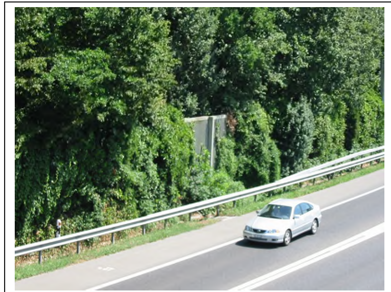
Murs paraphones disparaissant sous la végétation