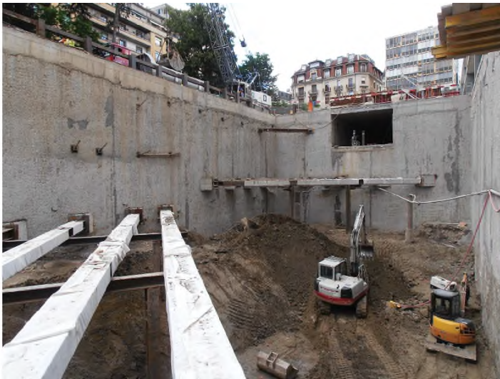
Excavation devant les parois moulées