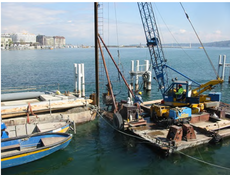
Battage de pieux