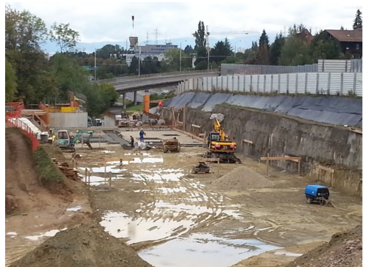
Fouille en pleine masse