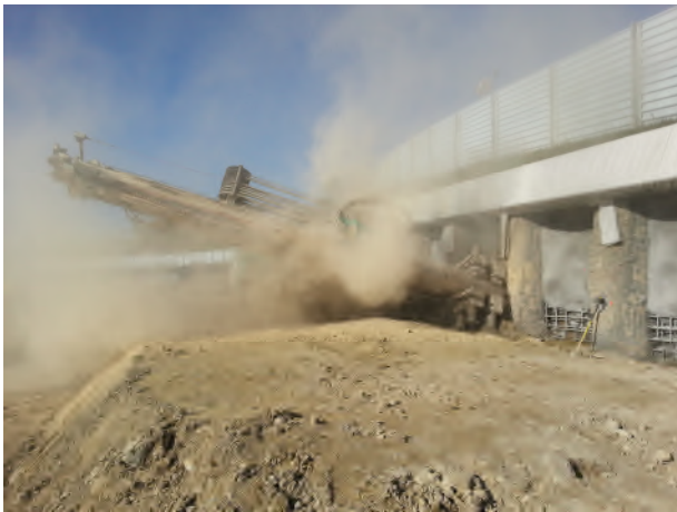
Réalisation des ancrages