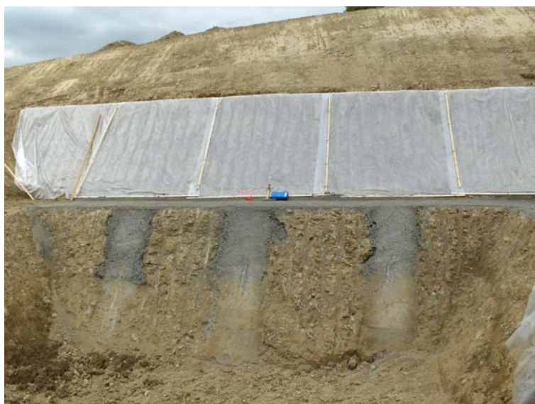
Photo : Talus de chantier renforcés par l'intermédiaire de contreforts.

La construction d'un ensemble de 4 immeubles comprenant 2 étages + attique sur rez et un niveau de sous-sol, ainsi qu'un garage souterrain attenant commun d'un niveau de sous-sol également, sur une parcelle en pente située route du Mandement à l'entrée Nord-Est du village de Satigny, a demandé la réalisation à l'amont de la fouille de talus de grande hauteur, atteignant 8.0 m. Le substratum molassique sub-affleurant au niveau du futur fond de fouille représentant un plan de glissement préférentiel pour les terrains meubles le recouvrant, et afin de permettre le stockage de matériaux excavés en tête de talus, les terrassements ont nécessité, après étude de stabilité, la réalisation de contreforts en béton CP 250, creusés perpendiculairement au plan des talus et fichés de 50 cm sous le fond de fouille.