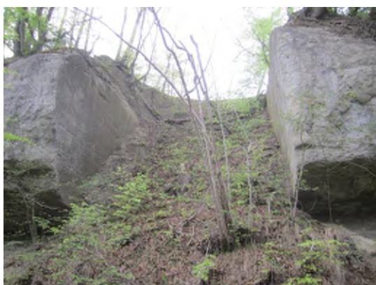
Exemple d'un phénomène de chute de blocs