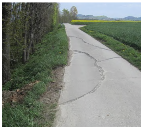
Départ d'un glissement de terrain

L'objet de cette étude s'inscrit dans le cadre de la cartographie des dangers naturels dans le Canton de Vaud. Le lot 14 concerne le Gros-de-Vaud et en particulier dans les bassins versants du Buron et du Talent, entre le bois du Jorat et le lac de Neuchâtel. Suite à la cartographie des inondations, laves torrentielles, chutes de pierres et de blocs, éboulement, écroulements, glissement de terrain permanents et spontanés, coulées de terre, affaissements et effondrements, il faut établir le jeu complet de cartes des phénomènes, cartes des intensités, fiches de scénarios et enfin la carte des dangers naturels.