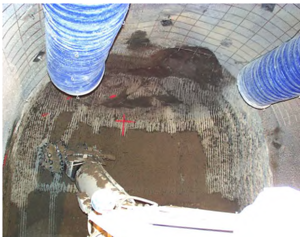
Excavation avec décollements Puits elliptique