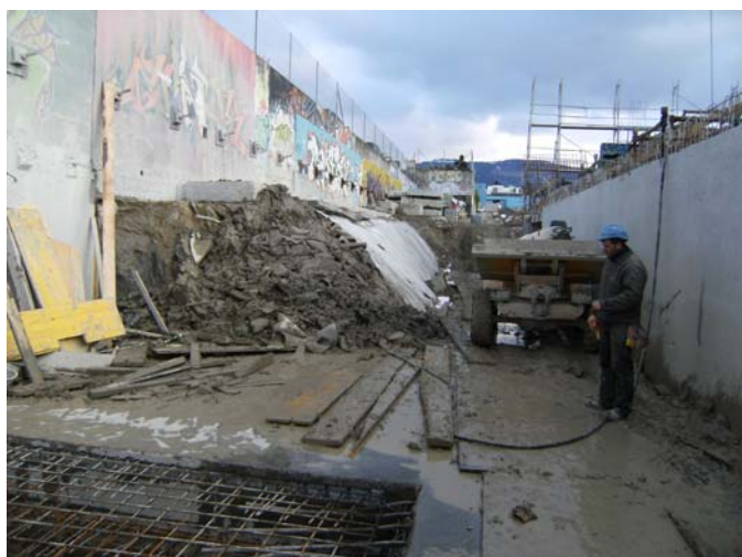
Photo : Travaux de terrassement en sous-œuvre par étapes avec mur périphérique existant ancré.

Ces travaux ont été effectués par étapes avec butonnage par ancrages précontraints du mur de soutènement.