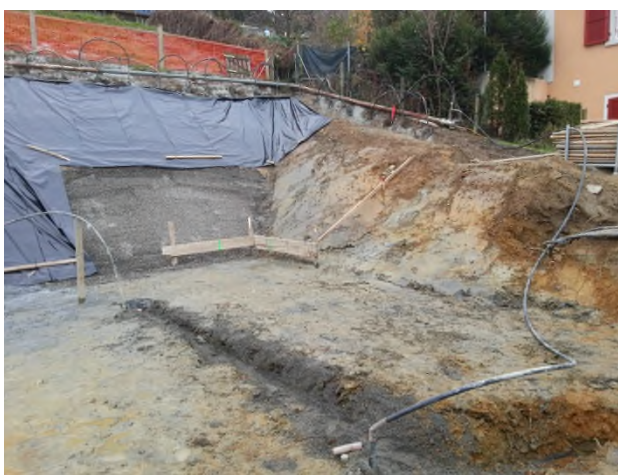
Renforcement du pied de talus